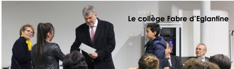
Le collège Fabre d'Eglantine

Le vendredi 4 novembre 2016, le collège Fabre d'Eglantine a inauguré sa première cérémonie républicaine de remise de diplômes en présence d'un aréopage d'élus et de partenaires de l'établissement... une cérémonie chargée de sens, de symboles et d'émotions.